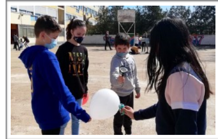
SCOOP 5, CEIP LA SALLE MANRESA - MANRESA

they absorb all the colours except the one that we see, which is reflected.” Bajo el divertido titular: “Popping machine” .