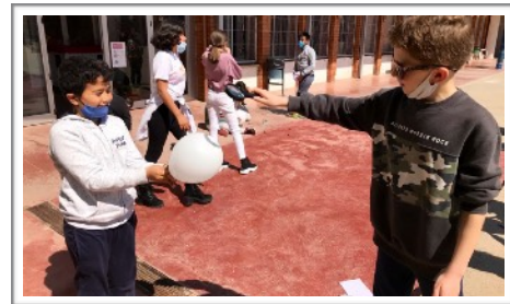
L@S GUAYABES, CEIP SANT MARTÍ - Cerdanyola del Vallès

Y nos despedimos compartiendo una foto con l@s: “6°ATEAM” del Colegio José Ortega Valderrama ganadores de la videoconferencia del LAB 2 y nuestro guía POL .