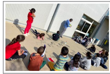
GM B MIGJORN- ESCOLA MARTA MATA (BARBERÀ DEL VALLÈS)

Desde el Colegio Estudiantes (Madrid), L@s HarryHorses nos resuelven el pequeño reto: ¿qué color llevaremos con la llegada del calorcito? : “Hemos podido observar y comparar que los colores tienen mucha relación con el calor. De ahí que en verano el negro no es un color que se suele llevar durante el día” . L@s Potasios del C.P. Laviada (Gijón) junto con L@s Pizzarines del CRA El Pizzarral (Segovia) añaden una importante reflexión : “Hemos investigado y descubierto que los Rayos UVA entran en las células de nuestra piel y la dañan. Por eso es importante hidratarnos la piel con cremas protectoras.”