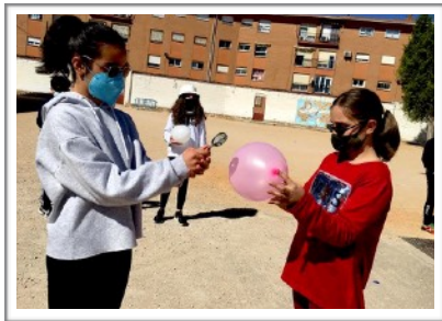
L@S PIB@S INVENCIBLES - CEIP GRACIANO ATIENZA - VILLARROBLEDO

L@s Experimentistas del CEIP Graciano Atienza (Villarrobledo), dicen que: “La relación entre la luz del Sol y los colores hace que los globos exploten antes o después.” Y sus compañer@s nos envían esta fantástica foto en acción: