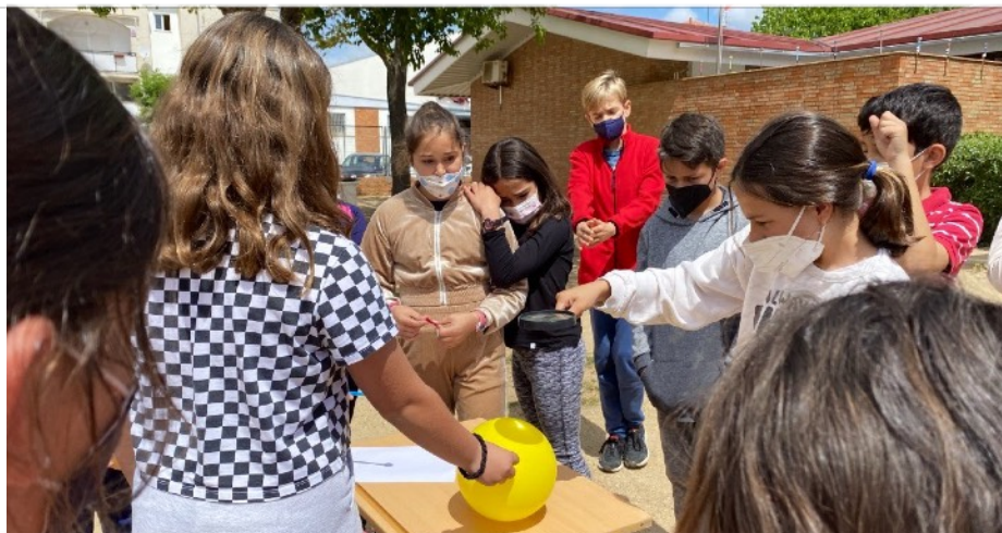
BRAWLERS DEL CEIP PADRE JESÚS - AYAMONTE (HUELVA)

LABORATORIO 3: ENERGÍA - RETO: HAZ VISIBLE LO INVISIBLE