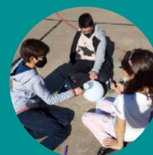
Frida Kahlo - Escola Municipal La Sínia (Cerdanyola del Vallès)