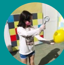
L@S MEJORES - Colegio San Cristobal (Albacete)