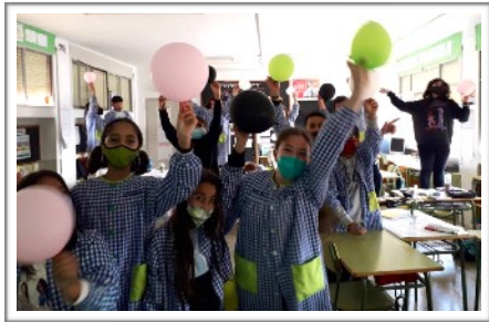
GASPAR 5ºB, ESCOLA GASPAR DE PORTOLÀ - BALAGUER

Els GRANS de Escola Rellinars (Rellinars), concluyen: “Tot el que tenim al nostre voltant, té o ens dona energia. Fonts d'energia que coneixem: biocombustible, biomassa, combustibles fòssils (carbó, gas natural, petroli), eòlica, geotèrmica, hidràulica, mareomotriu, nuclear i solar.”